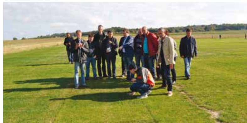
Visite des intendants russes sur les parcelles de sélection gazon DLF France - Les Alleuds - octobre 2017

russes ont choisi les variétés gazon DLF pour le semis et l'entretien des stades et terrains d'entraînement accueillant l'événement. Cela concerne huit stades russes sur les douze impliqués dans la compétition, avec notamment des ray-grass anglais tétraploïdes.