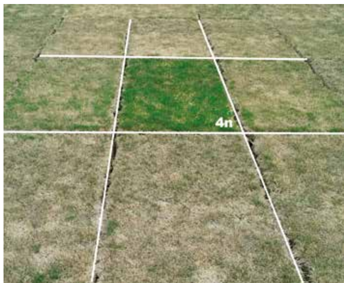
Tolérance au sec des ray-grass tétraploïdes

Sachant qu'il faut plus de 10 ans pour créer une nouvelle variété, nos équipes préparent déjà les gazons de demain, qui feront face lors des prochaines compétitions sportives à venir, qu'elles soient masculines ou féminines !